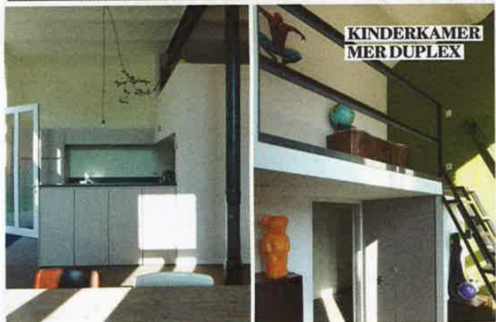
KINDERKAMER MER DUPLEX