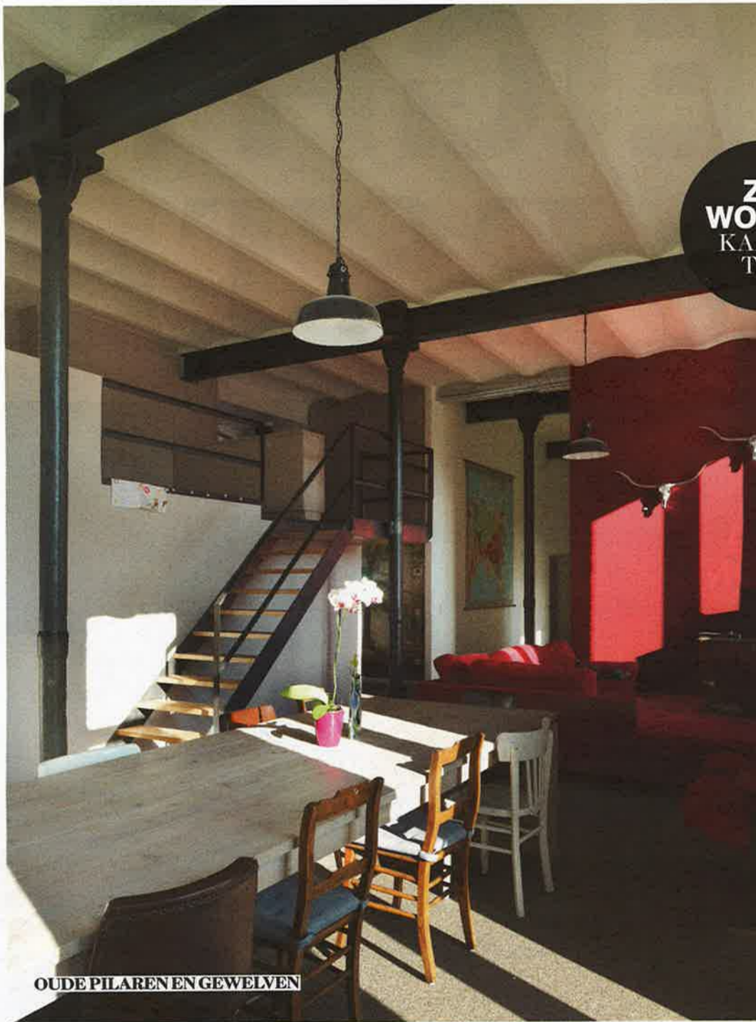
OUDE PILAREN EN GEWELVEN