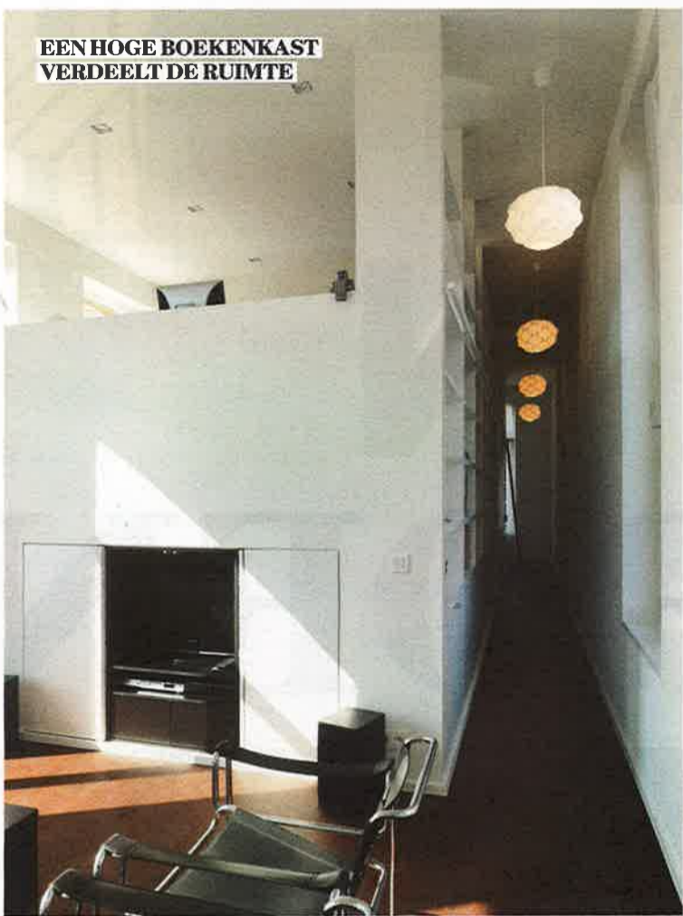
EEN HOGE BOEKENKAST VERDEELT DE RUIMTE