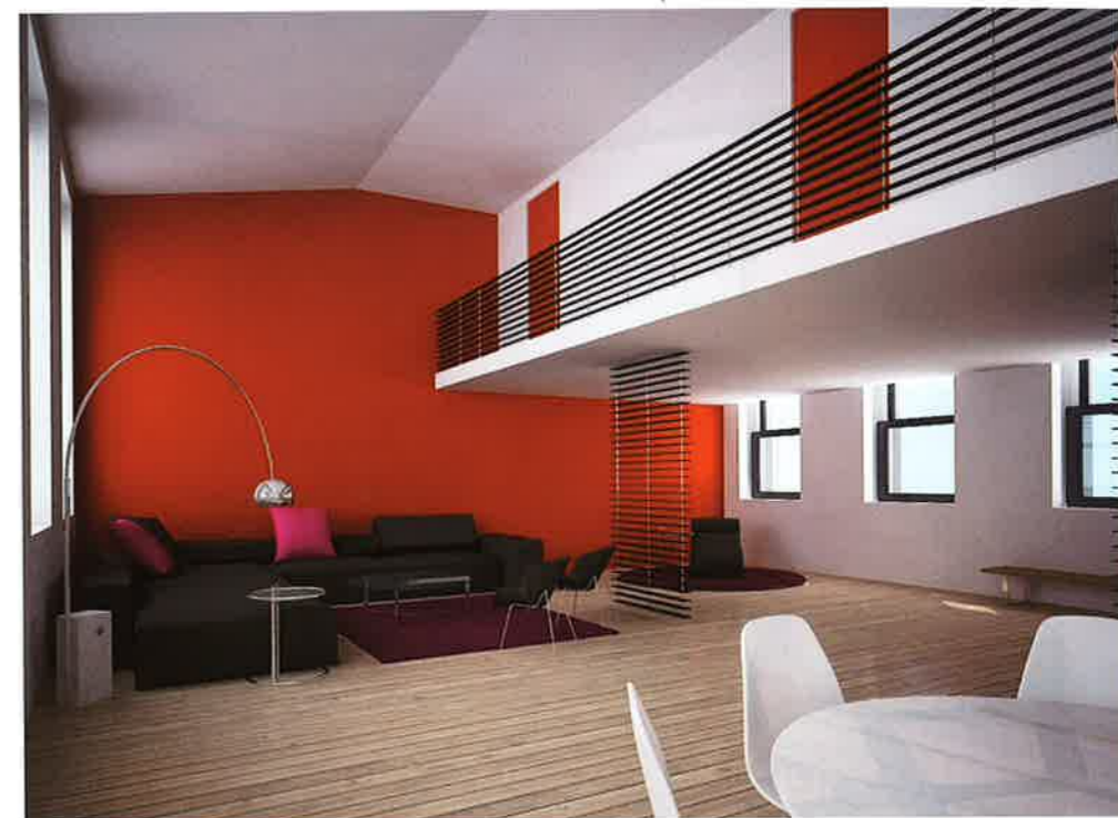
De hele site zal uiteindelijk ongeveer 400 woonegelegenheden (lofts, appartementen, een- en tweezinswoningen) en vier ondergrondse parkeergarages tellen.

RENOVATIE VAN PAVILJOENEN EN NOORDZUIDGEBOUW Door de ommuring behoudt de site haar geborgenheid. "Maar de woonegelegenheden worden wel verankerd in de stedelijke omgeving door tal van wandelen en fietsverbindingen," vertelt architect Lieven Achtergael. De toewijzing van de opdracht gebeurde via een architectuurwedstrijd. Een belangrijke voorwaarde voor het opstellen van een masterplan was het behoud van de beschermde monumenten. ▼